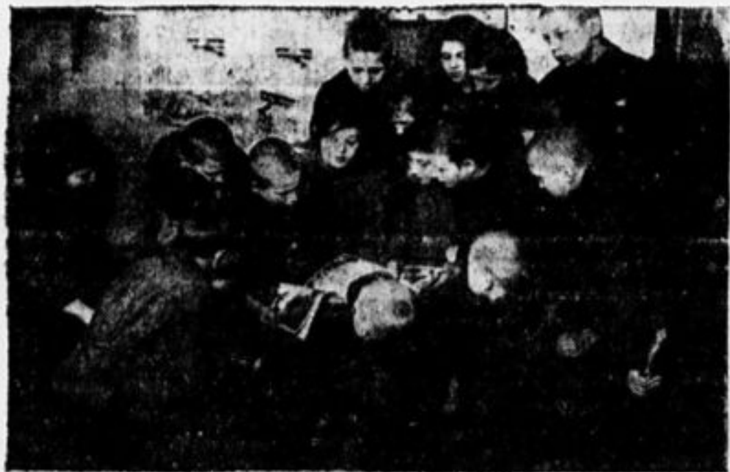
Пионеры читают с октябрятами № 13 «Барабана», посвященный работе с октябрятами.