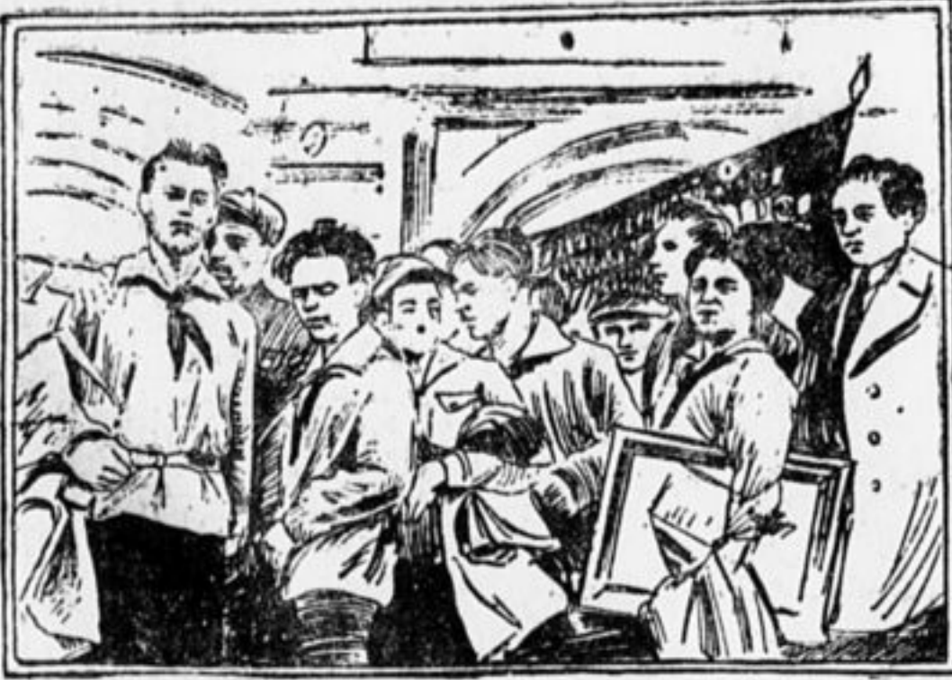
Председатель делегации г. Цабуш приветствует собравшихся молодых рабочих Москвы.

Буржуазные и меньшевистские газеты постоянно нам твердят, что в СССР рабочие и рабочая молодежь живут в самых ужасных условиях, что рабочая молодежь загнана в подполье, задушена.